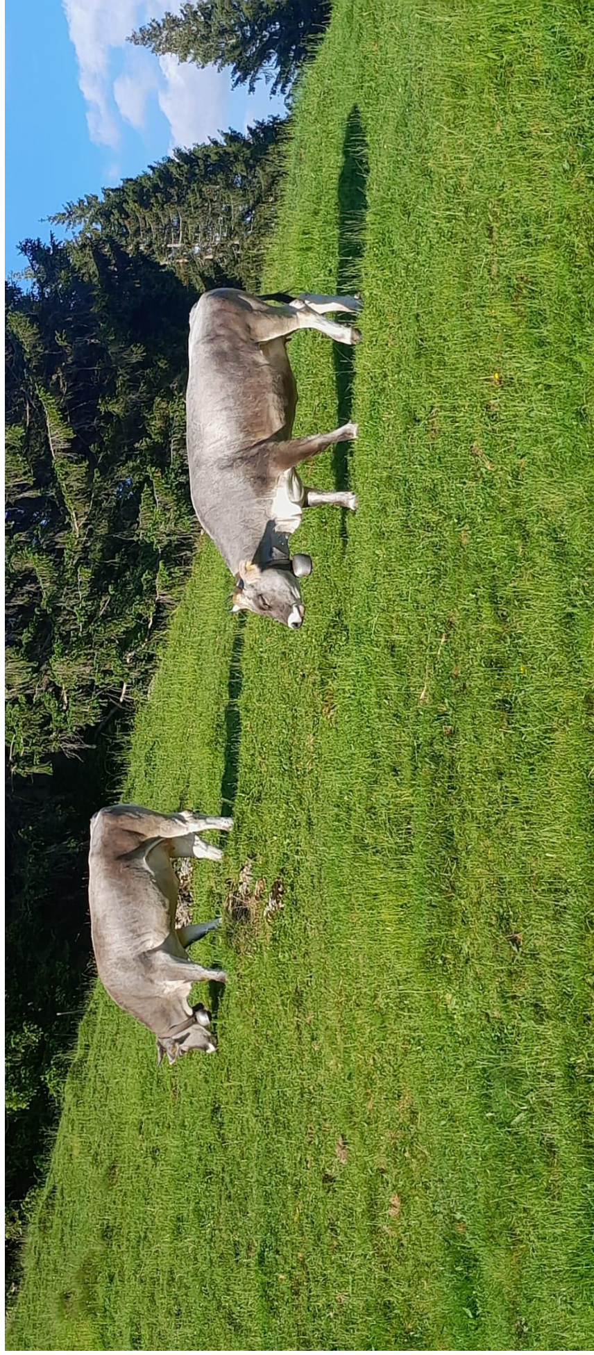
Familie Wäli Nesslau