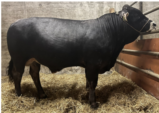
Evergreen mit 11 Monaten

Beurteilung Mutterkuh CH: 93/93/93 EX 93 Beurteilung Braunvieh CH 3-3-3-83 Maximum Tageszunahmen: 1541 Gramm pro Tag