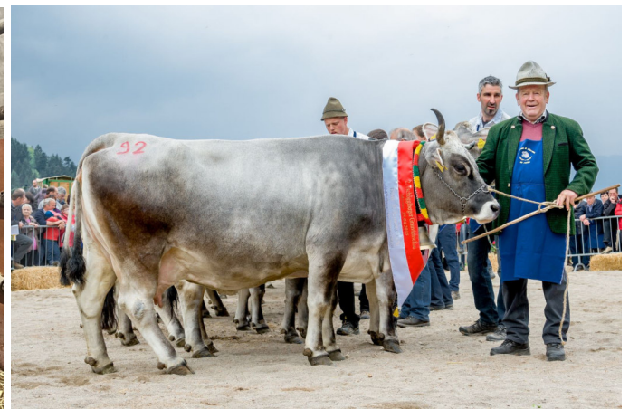
Dolly mit 14 Jahren in der 11 Laktation Bericht von Ady Hotz