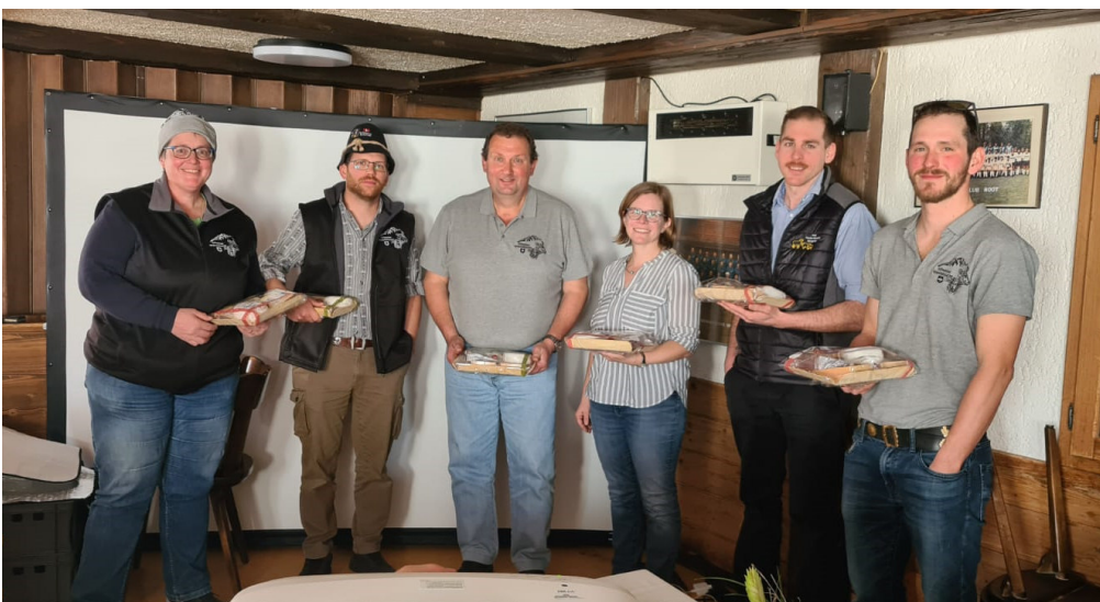
OK Grauvieh Expo