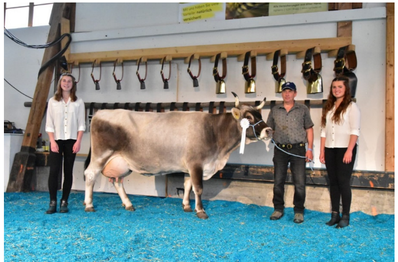
Kategorie 11 Gana V: Dinar von Franz Guntern