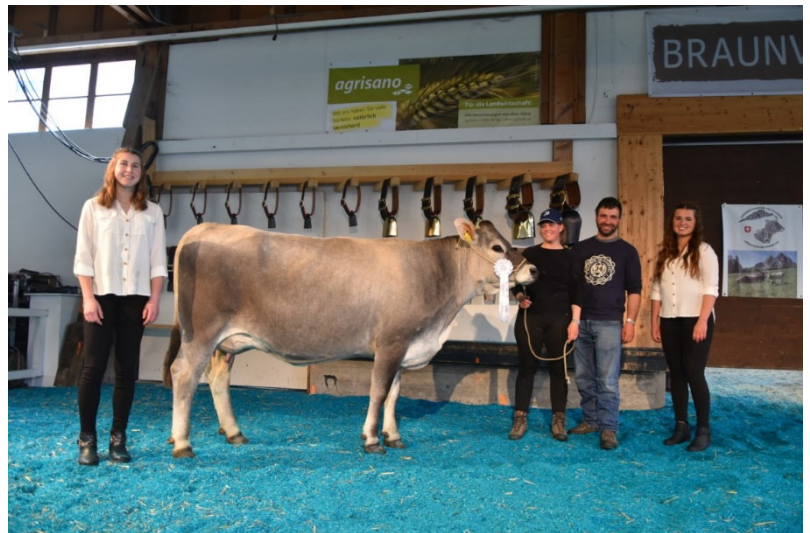
Kategorie 5 Fanny V: Arkos von Michele und Gianpaolo Crameri