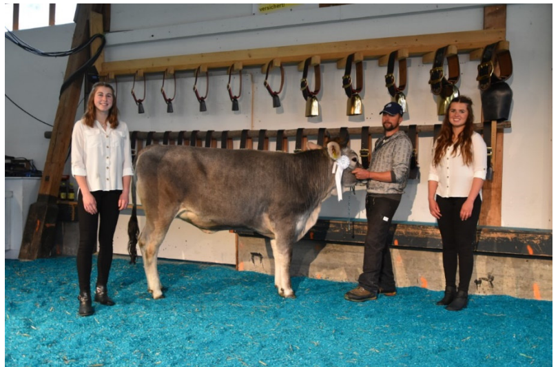
Kategorie 2 Trista V: Nordlicht von Heinz Gantenbein