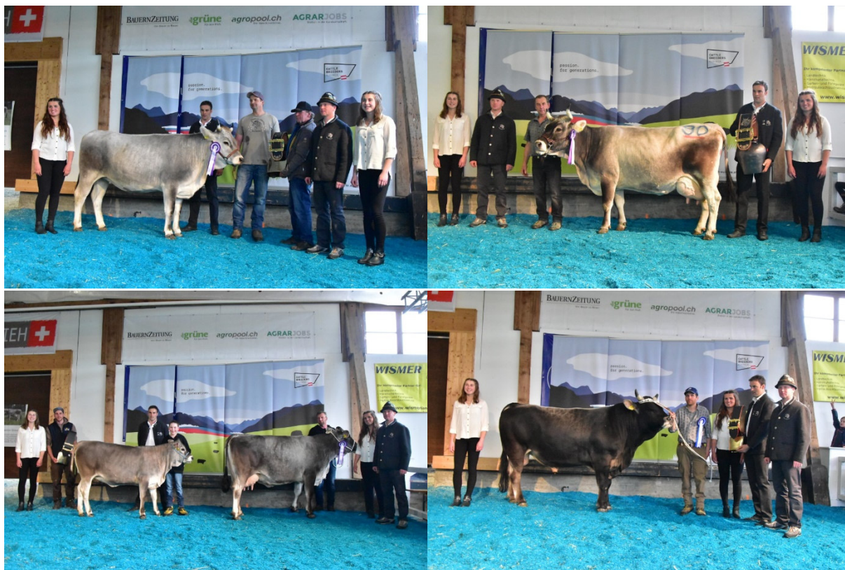
Missen und Mister Grauvieh Expo 2022

Vereinszeitschrift für die Mitglieder des Schweizer Grauviehzuchtvereins