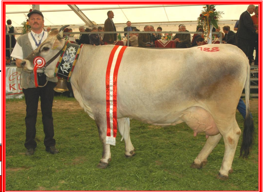
Gesamtsiegerin ältere Kühe Imst 2004